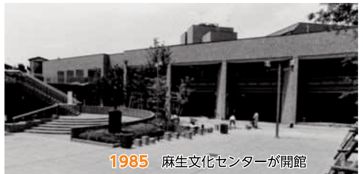
1985 麻生文化センターが開館