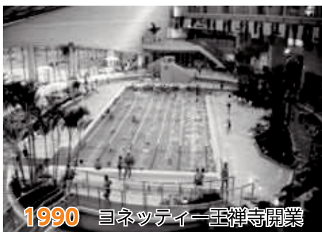
1990 ヨネッティー王禅寺開業