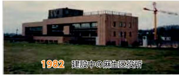
1982 建設中の麻生区役所