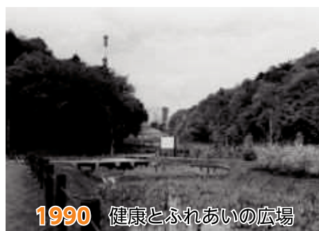
1990 健康とふれあいの広場