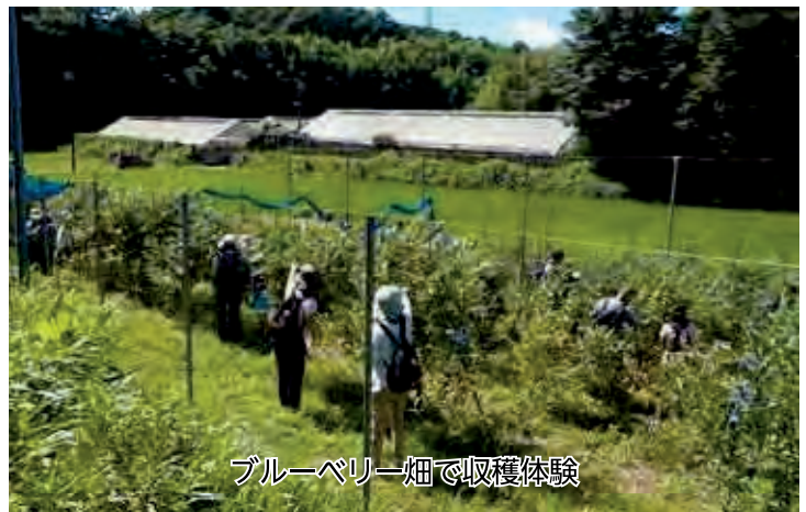
ブルーベリー畑で収穫体験