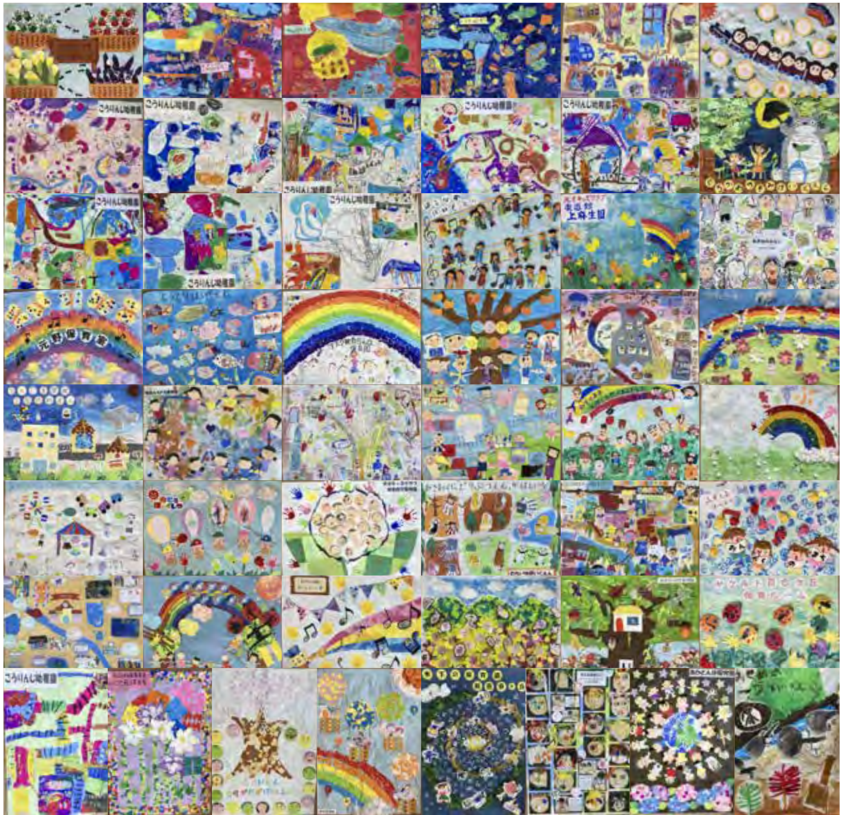
「あさおの未来」をテーマに区内の園児が描いた作品です