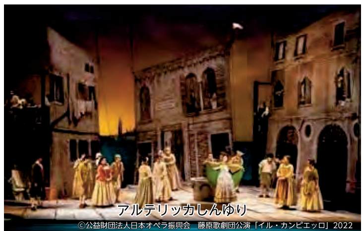
アルテリッカしんゆり