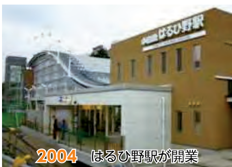
2004 はるひ野駅が開業