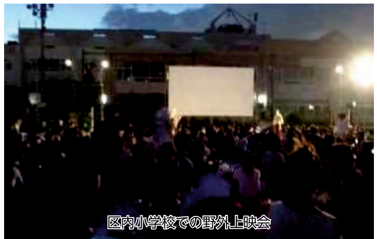
区内小学校での野外上映会