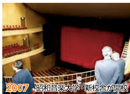
2007 昭和音楽大学・新校舎が開校