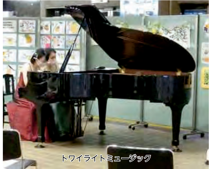
トワイライトミュージック