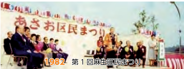
1982 第1回麻生区民まつり