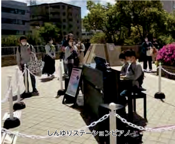
しんゆりステーションピアノ