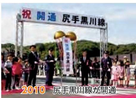
2010 尻手黒川線が開通