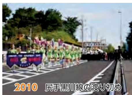
2010 尻手黒川線の渡り初め