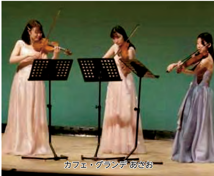
カフェ・グランデ あさお