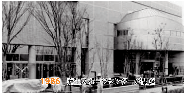
1986 麻生スポーツセンターが開館