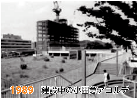
1989 建設中の小田急アコルデ