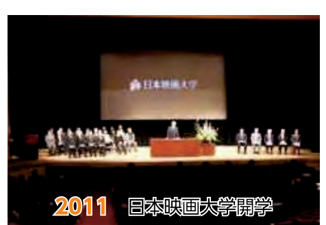
2011 日本映画大学開学