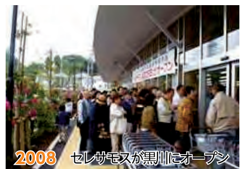
2008 セシガモスが黒川にオープン