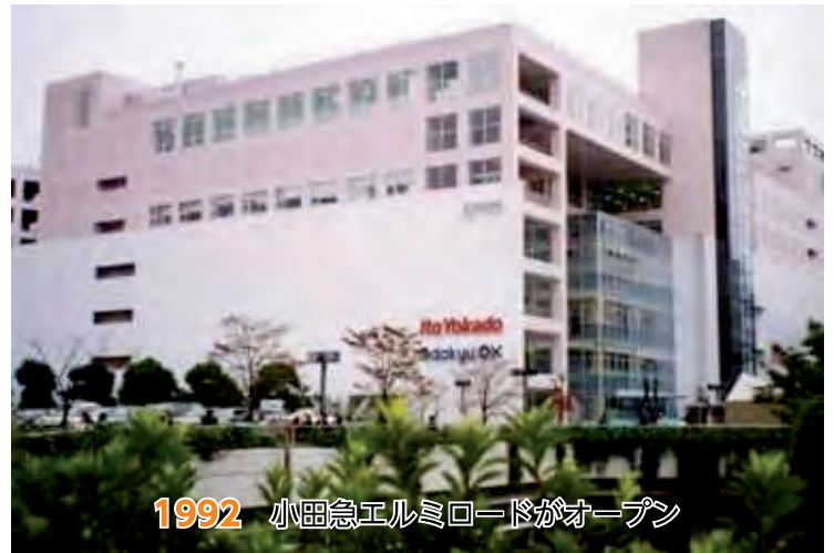
1992 小田急エルミロードがオープン