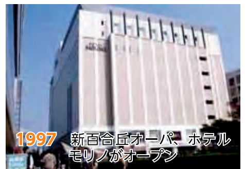
1997 新百合丘オーパ、ホテルモリノがオープン