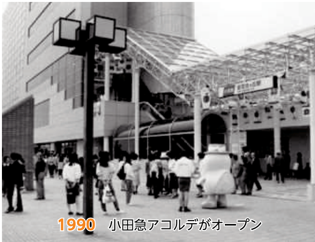
1990 小田急アコルデがオープン