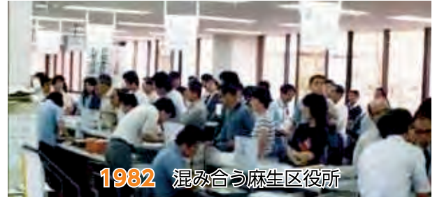
1982 混み合う麻生区役所