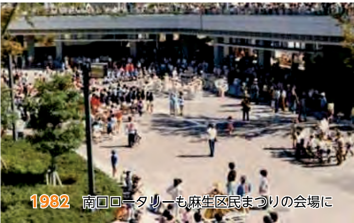
1982 南口ロータリーも麻生区民まつりの会場に