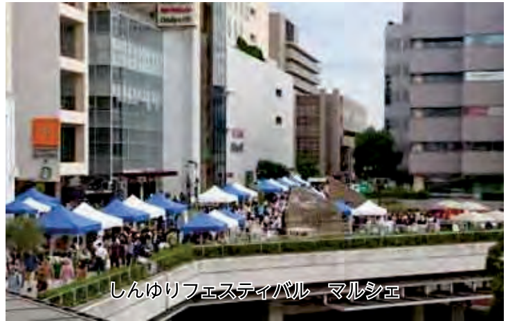
しんゆりフェスティバル マルシェ